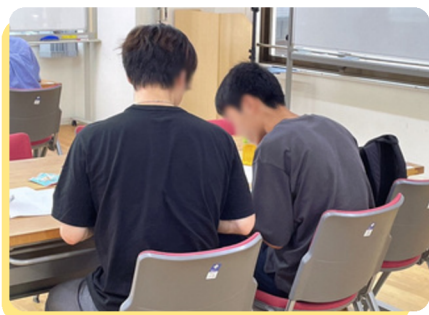
学習支援「まなびれっじ」

私が苦戦しているところを どの問題も 順を追って丁寧に 教えてくださり 解き方を理解することが できました。