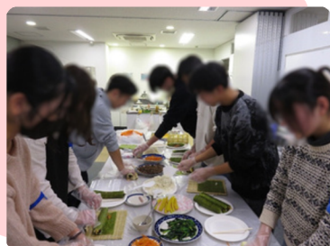
交流会「キンパ作り」