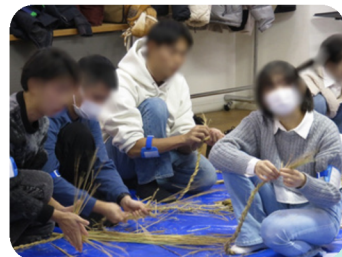
交流会「しめ縄作り」

勉強で不安なところを 解消することができました。 また勉強のモチベーションを 立て直せました。